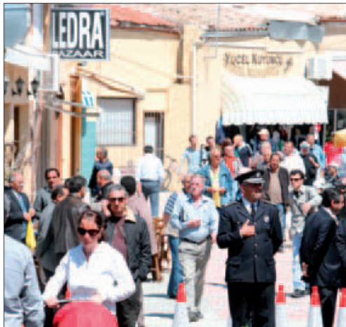
Μετά το άνοιγμα της Λήδρας, το παραδοσιακό εμπορικό κέντρο αναζωογονήθηκε.

Ένας στους δύο χρήστες του οδοφράγματος της Οδού Λήδρας, είτε Ελληνοκύπριος είτε Τουρκοκύπριος, μεταβαίνει πιο συχνά στην άλλη πλευρά από τότε που άνοιξε